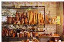
a. Dialogue .....

Listen to the dialogues and match them with the photos below.