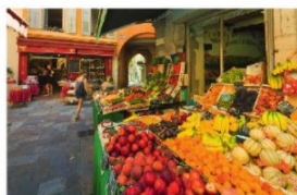
b. Dialogue .....