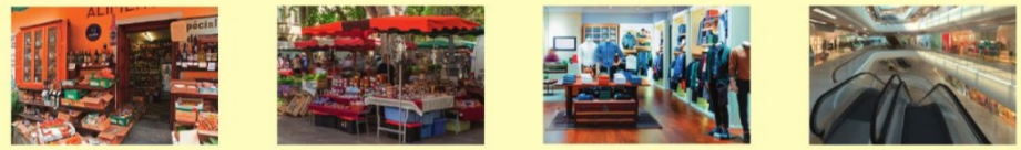
une épicerie un marché un magasin un centre commercial