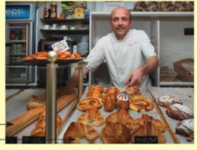
une baguette un croissant