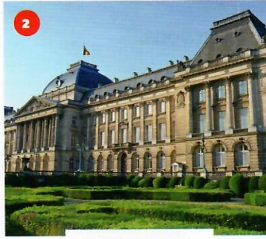
le Palais royal