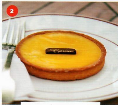
2 la tarte au citron