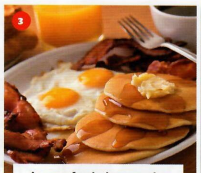
3 des œufs, du bacon, des crêpes et un café