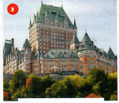
le château Frontenac