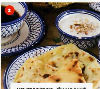
2 un msemen, du yaourt et un café