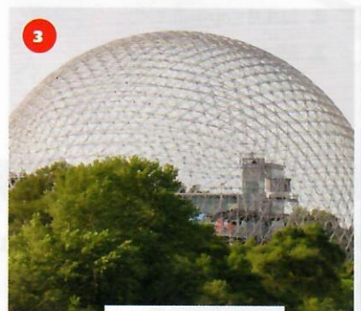
3 la Biosphère

au Canada (Québec) en France en Belgique