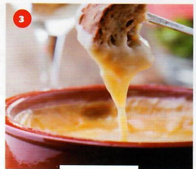
3 la fondue