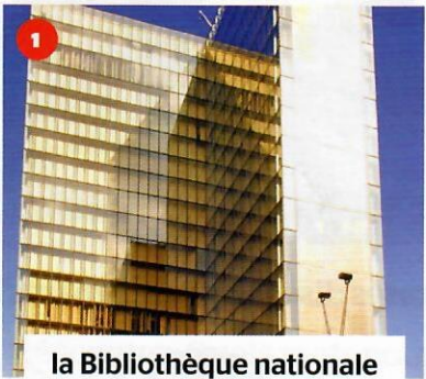
1 la Bibliothèque nationale de France