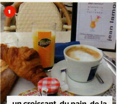
1 un croissant, du pain, de la confiture et un café