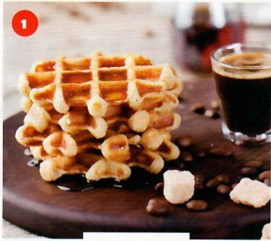
1 la gaufre