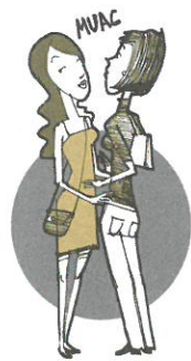
Dar un beso