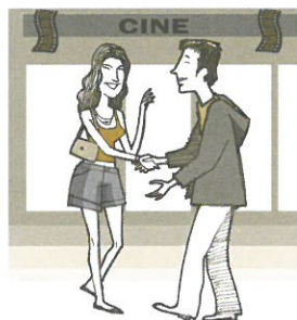
Dar la mano