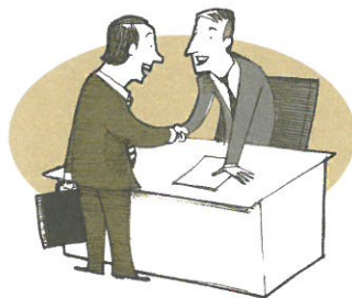
Mucho gusto, encantado de conocerle