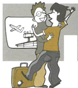
Dar un abrazo